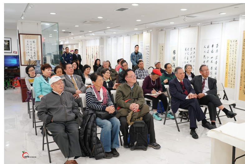
梁君度老師書法養生與禪眾人留心聽講，場面安靜。